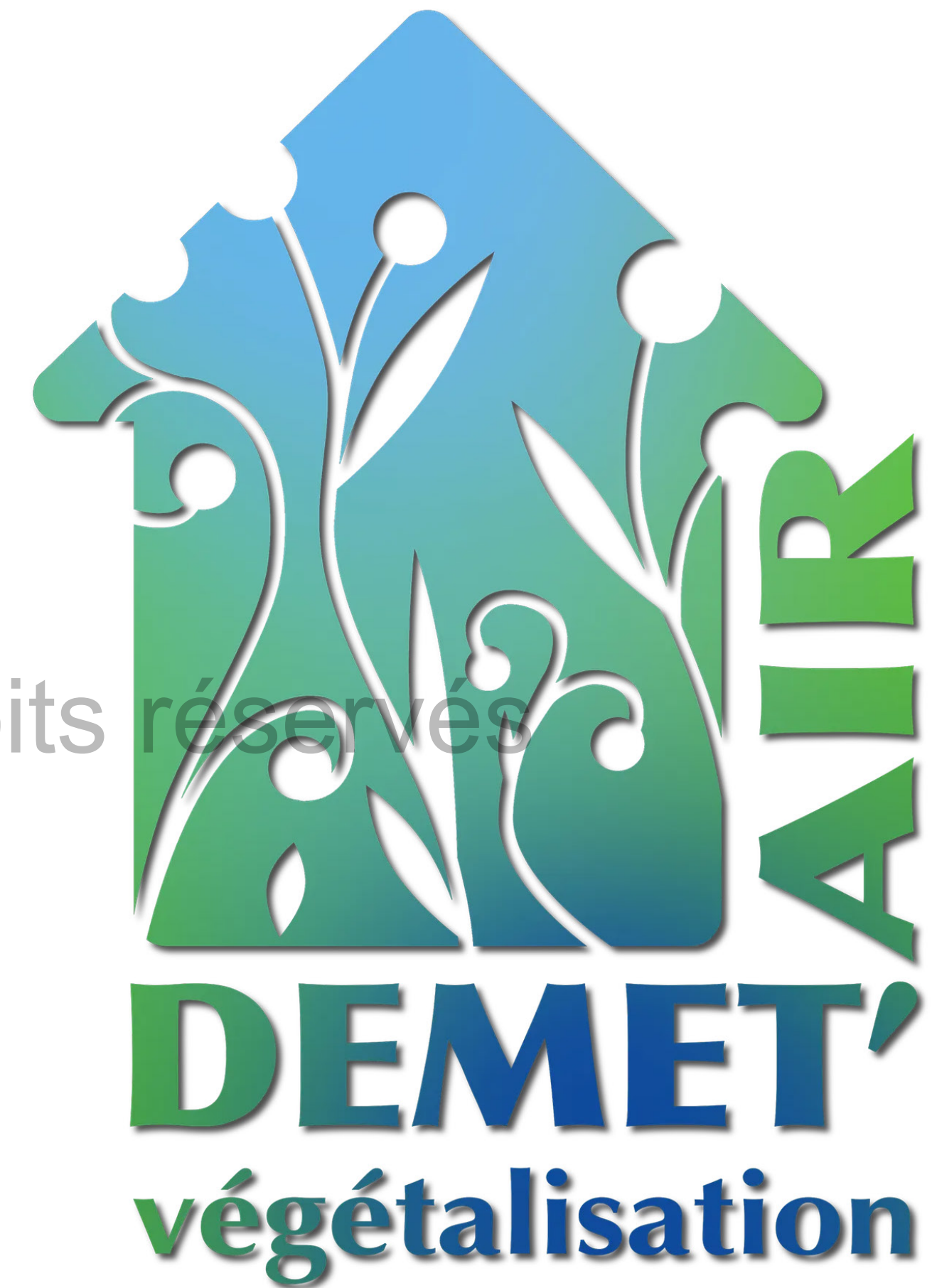
Ancien logo Demet'air

Le tout est de donner une dimension plus actuelle et de décliner ce logo en charte graphique pour créer un univers entier autour de la marque et de pouvoir l'utiliser sur différentes supports.